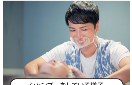
シャンプーをしている様子