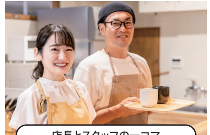
店長とスタッフの一コマ