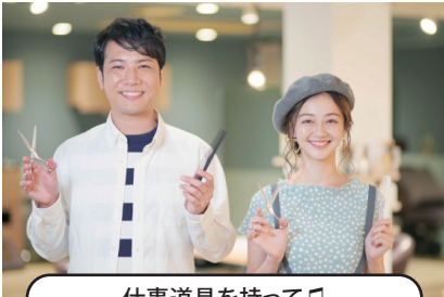
仕事道具を持って♪