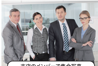
支店のメンバーで集合写真